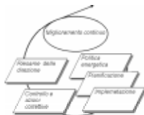
Figura 2 Ciclo PDCA

In particolari settori, inoltre, una corretta gestione energetica influisce notevolmente sull'immagine del prodotto o del servizio offerto e può costituire un fattore differenziante nelle scelte dei consumatori.